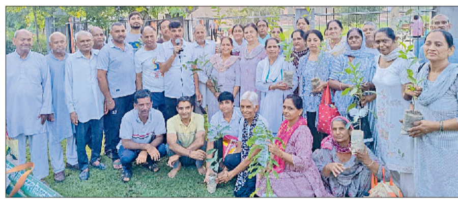
पानीपत। योग साधकों को औषधीय पौधे वितरित करते हुए योग शिक्षक।