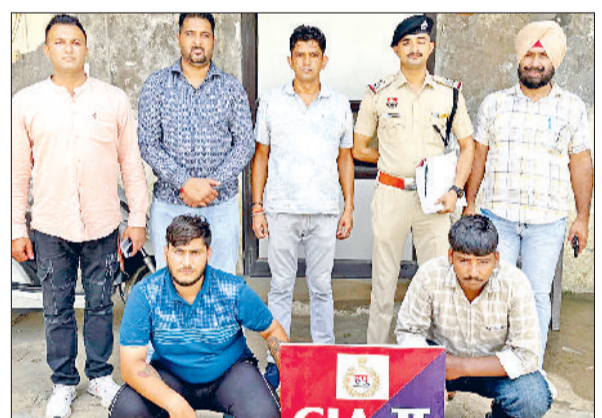
अंबाला। दो करोड़ की हेरोइन के साथ पकड़े गए एक्टिवा सवार।

नशा तस्करी के खिलाफ पुलिस लगातार कड़ी कार्रवाई कर रही है। एक बार फिर पुलिस ने हेरोइन तस्करी के एक बड़े मामले का भंडाफोड़ कर दो एक्टिवा सवार युवकों को काबू किया है। पुलिस ने आरोपियों के कब्जे से दो करोड़ की हेरोइन जब्त की है। अब पुलिस आरोपियों से पूछताछ कर रही है। दरअसल पुलिस की ओर से नशा तस्करी की धरपकड़ के लिए स्पेशल अभियान चलाया जा रहा है। इसी अभियान के तहत अब सीआईए टू ने थाना पड़ाव क्षेत्र के गांव शाहपुर के सामने जीटी रोड नशा तस्करी के मामले में अंबाला छावनी के बंगाली मोहल्ला के