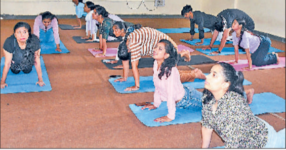
पानीपत। आईबी कॉलेज में योग करती शिक्षिका व विद्यार्थी।

छात्राओं एवं प्राध्यापिकाओं को पहले से इस भावनात्मक त्यौहार के प्रति जागरूक करना ही इस प्रकार के आयोजनों को मनाने का