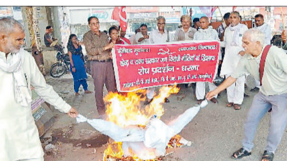
पानीपत। वामपंथी पार्टियों के कार्यकर्ता पीएम मोदी का पुतला फूंकते हुए।