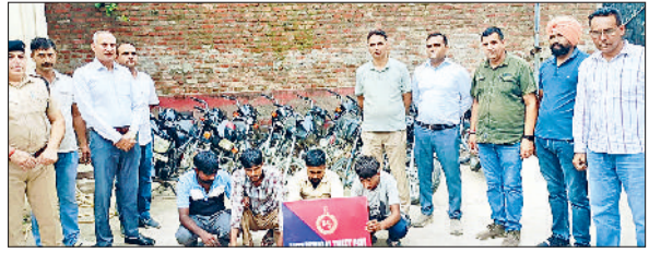
अंबाला। चोरी की मोटरसाइकिलों के साथ वाहन चोर गिरोह के सदस्य।

देवी व्यवहार बेहद सराहनीय है। उन्होंने कहा बहनों ने कहा है कोई एक अच्छी आदत कोई एक बदलाव स्वयं में लाओ। उन्होंने कहा कि मैं आज से परमात्मा को सबसे पहले धन्यवाद करूंगी उनको याद करूंगी, उसके बाद अपने परिवारजनों संगठन या अन्य किसी को याद करूंगी। उन्होंने कहा भविष्य में कभी भी अगर हमारी सेवा की आवश्यकता होगी तो हम हर समय सहयोग देने के लिए तैयार हैं। अंत में सभी ने शुभ संकल्पों की प्रतिज्ञा करके रक्षासूत्र बांधकर मुख मीठा किया।