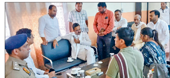
घरौंडा के पीडब्ल्यूडी विश्राम गृह में लोगों की समस्याएं सुनते विधानसभा अध्यक्ष हरविन्द कल्याण।

हरविन्द कल्याण ने दो घंटे से अधिक समय तक घरौंडा के पीडब्ल्यूडी विश्राम गृह में लोगों से परेशानि जानी