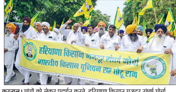
करनाल। मांगों को लेकर प्रदर्शन करते हरियाणा किसान मजदूर संघर्ष मोर्चा पदाधिकारी व सदस्य।

हरियाणा किसान मजदूर संघर्ष मोर्चा के आह्वान पर शुक्रवार को प्रदेशभर में किसानों ने विरोध प्रदर्शन कर सरकार को चेतावनी दी। करनाल में भारतीय किसान यूनियन (सर छोड़नाम) के बैनर तले सैकड़ों किसान सेक्टर-12 हुडा मैदान में इकट्ठा हुए।