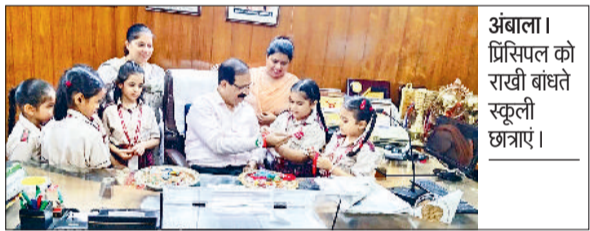
अंबाला। प्रिंसिपल को राखी बांधते स्कूली छात्राएं।

अंबाला शहर के डीएवी सीनियर सैकेंडरी पब्लिक स्कूल में रक्षाबंधन व स्वतंत्रता दिवस के उपलक्ष्य में तिरंगा राखी मेकिंग तथा देश के सैनिकों, पुलिसकर्मियों एवं भाइयों के लिए पत्र लेखन प्रतियोगिता का भव्य आयोजन किया गया। इस अवसर पर विद्यार्थियों ने अपनी सृजनात्मकता और देशभक्ति की भावना को सुंदर ढंग से प्रस्तुत किया। कक्षा 3 से 6 तक के छात्रों के लिए तिरंगा राखी निर्माण प्रतियोगिता रखी गई जिसमें बच्चों ने तिरंगे रंगों से सजी सुंदर राखियों का निर्माण किया। वहीं, कक्षा 7 से 12 के छात्रों ने देश के जवानों,