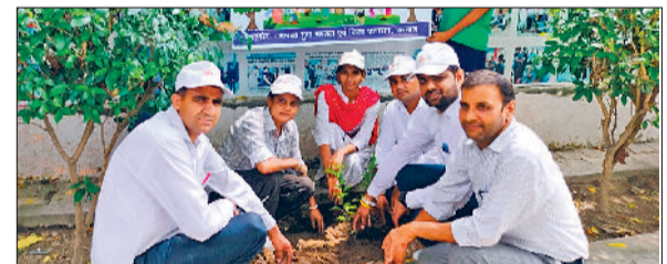
इंद्री के गांव जोहड़ माजरा में पौधारोपण करते आयोजक।