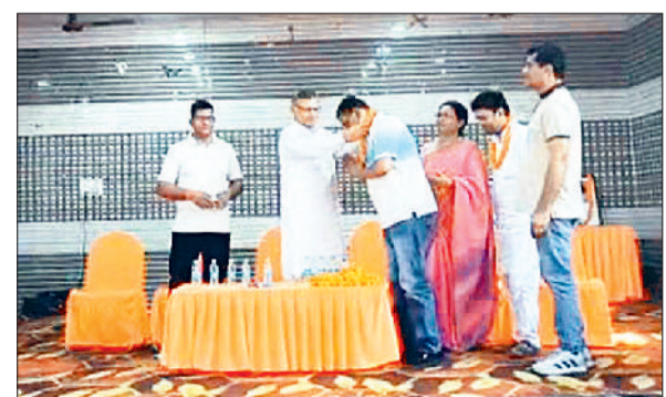
कहा कि विशाल तिरंगा यात्रा 12 अगस्त को दोपहर दो बजे प्रताप नगर अनाज मंडी से शुरू होकर नेशनल हाइवे के विभिन्न गांवों से होते हुए शाम तीन बजे छहरोली अनाज मंडी में पहुंचेगी। वहां से गांव