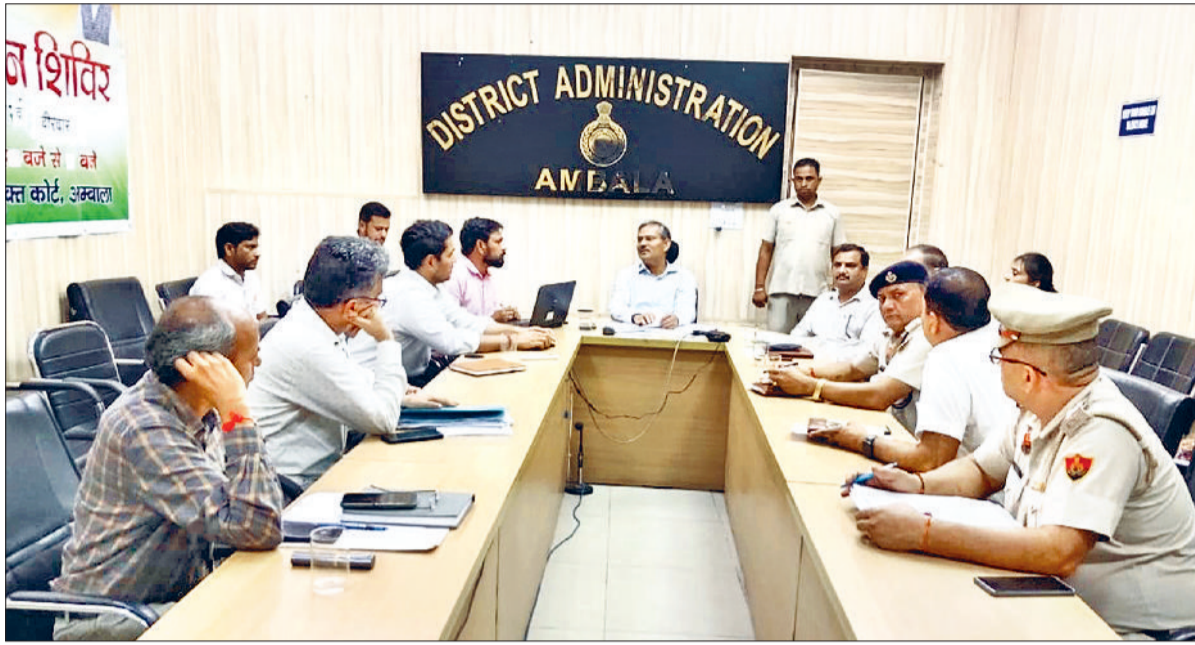
अंबाला। सीएम की मीटिंग में मौजूद अधिकारी।

उन्होंने लंबित शिकायतों की समीक्षा करते हुए कहा कि जिन जिलों में शिकायतें लंबित हैं, उनका शीघ्र निपटारा किया जाए। यदि कोई शिकायत समाधान नहीं होने वाली है तो संबंधित